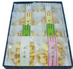
新虎焼詰め合せ8個入