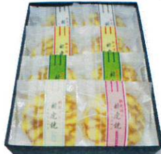
新虎焼詰め合せ8個入