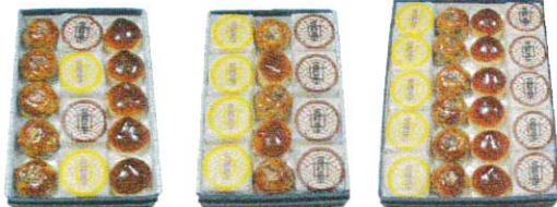
T1 2,340円 T2 2,280円 T3 3,580円

『文銭最中』小豆・栗『あずま饅頭』『栗の子』の4種類 の味が楽しめる詰め合せです。 日持ち7日間 (夏期5日間)